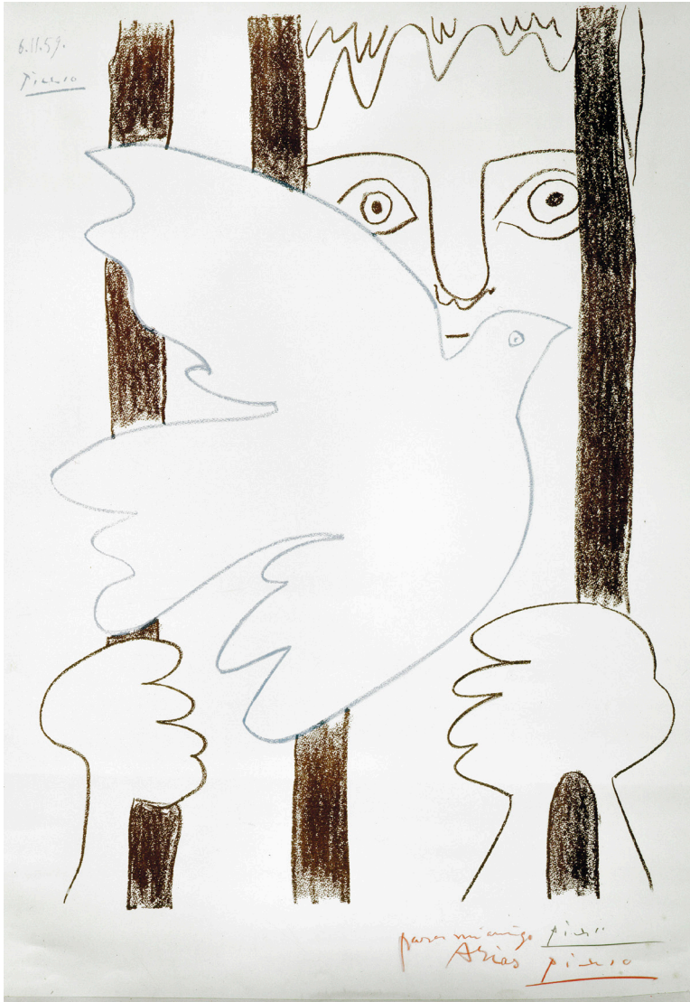
“Preso con paloma de la paz”, de Picasso.