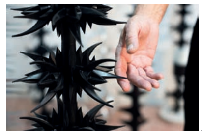
1 Arquitecturas de la intimidación, 2017 Módulos de valla, acero