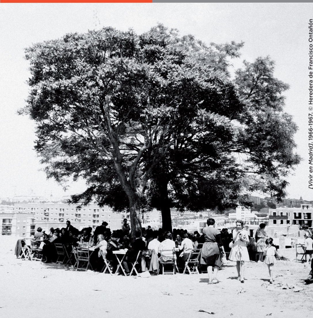
[Vivir en Madrid]. 1966-1967.